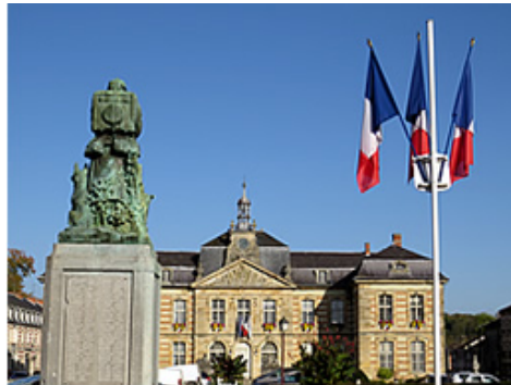
Il regarde l'Hôtel de ville

Le monument est une volonté et une propriété communale encouragé par la loi du 25 octobre 1919 qui accordait aux communes une subvention pour l'édification ; à noter que la subvention d'état était proportionnelle au nombre de victimes inscrites. Chaque commune a choisi son style, sa devise, son endroit d'implantation. A cette époque, l'état a remis à chaque commune un livre d'or sur lequel étaient inscrits les noms des combattants autorisés à figurer sur le monument. Aujourd'hui, de ces livres, combien en reste-t-il ? Pour être inscrit, il fallait remplir obligatoirement deux conditions : sur l'état-civil, le défunt devait porter la mention « Mort pour la France » et être né ou domicilié légalement dans la commune considérée.