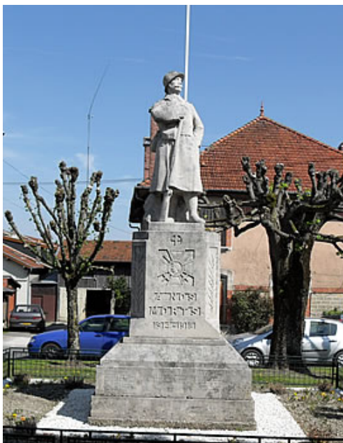
Le monument aux morts des Islettes

Sa sépulture se trouve dans le grand carré militaire dans le cimetière général de Beauvais. Cette nécropole regroupe 606 noms.