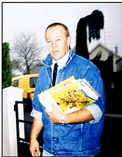
Distribution à Menou au quartier du Romarin

La fin de l'année et les calendriers font bon ménage, surtout dans certaines professions et services. Les facteurs et les pompiers sont en première ligne pour continuer cette agréable tradition.