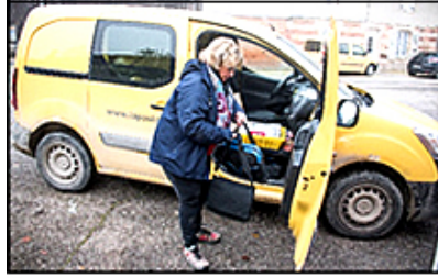
Distribution à La Neuville-au-Pont en 2019

À partir des années 1960, le métier de facteur s'est peu à peu féminisé. Cela correspond, entre autres, à la fin des déplacements à vélo dans les villages. Beaucoup de métiers sont alors dévolus aux hommes. Les femmes sont présentes essentiellement dans l'enseignement, le social, la santé, dans les bureaux et pour les travaux ménagers. Jusqu'à ces années, la plupart des femmes n'ayant pas de profession rémunérée sont dénommées « femmes au foyer » ; et pour leurs papiers personnels elles cochent la case « sans profession » à la colonne demandée. Cela a pu choquer vu la réalité de leurs contraintes journalières, souvent remplies au maximum.