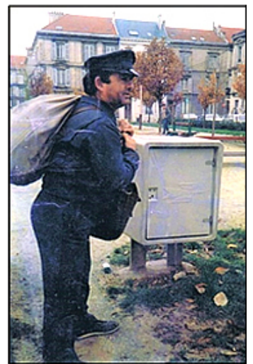
Un facteur argonnais dépose le reste de sa tournée dans un coffre relais à Reims en 1987

Par contre les souvenirs de jeunes facteurs