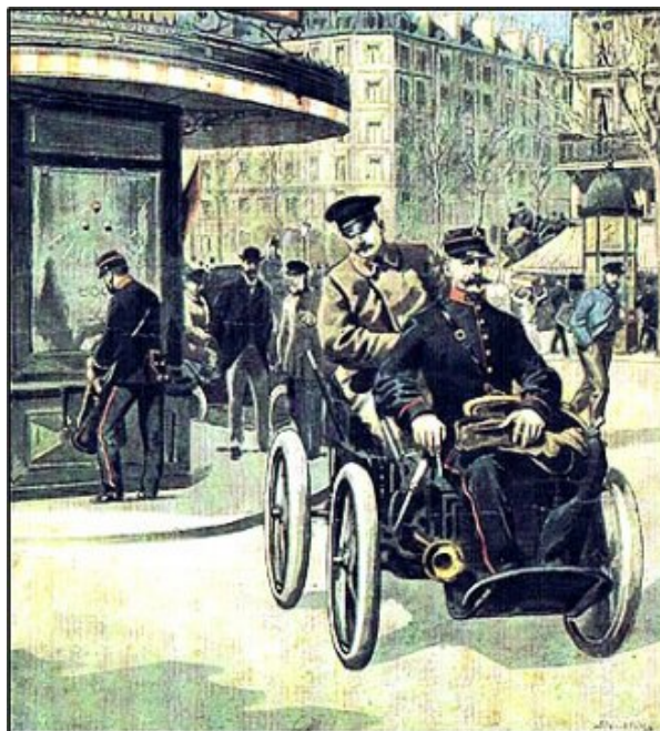
Votre préposé PTT vous offre ses vœux en 1894 Sur un calendrier de 1988 à Verrières.

À ce propos, j'ai entendu plusieurs fois « on a l'air de quémander ». Par contre, dans un village avec sidex, un fidèle du calendrier est obligé de guetter le passage de la factrice qu'il connaît à peine pour pouvoir échanger quelques mots et donner ce qu'il a préparé pour la remercier de ce calendrier.